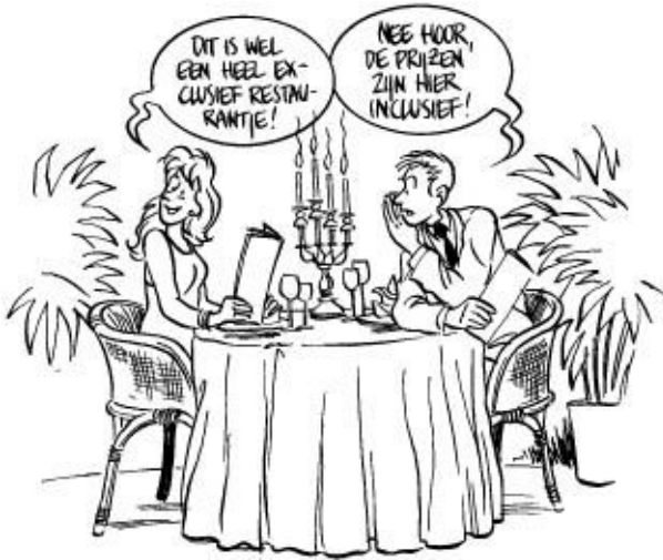
Figuur 4-8: Inclusief of exclusief?

De producten die in de winkels liggen, zijn meestal geprijsd. Hoe er geprijsd is, met plakkertjes of met kaartjes op de rekenen, is per winkel verschillend. Wat niet verschillend is, is dat in elke winkel de prijzen inclusief BTW zijn.