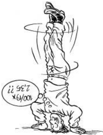
Figuur 4-9: Andersom rekenen is moeilijk

Als je de prijs exclusief altijd op 100% stelt en er komt 17,5% BTW bij, dan is de prijs inclusief BTW 117,5%. Dat is handig om te onthouden als je moet terugrekenen.